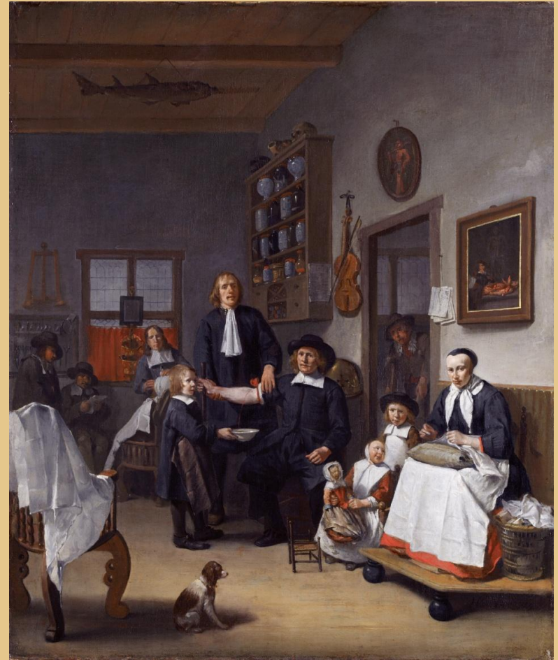
Картина в общественном достоянии

Художник Эгберт ван Хемскерк «Я. Франц с семьей в парикмахерской»