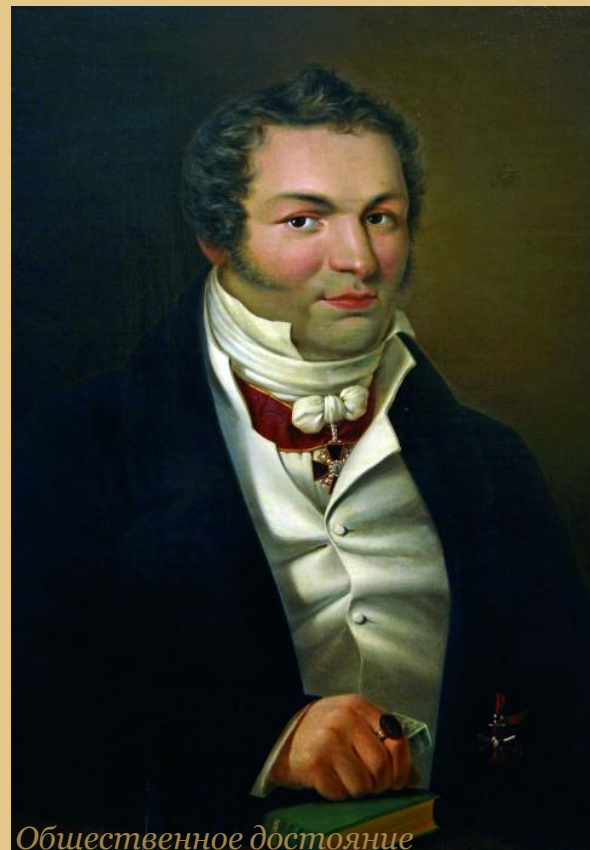
Общественное достояние Портрет М.Я. Мудрова (1776 – 1831).