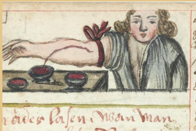
Изображение кровопускание в медицинском пособии (ок. 1675 г.)