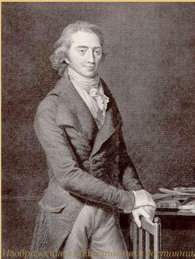
Изображение в общественном достоянии Кристоф Вильгельм Гуфеланд (1762 – 1836)

«Тем не менее теорией Бруссе увлекались многие врачи, например, Гуфеланд в Германии, а в России одним из ее многочисленных приверженцев был М. Я. Мудров»