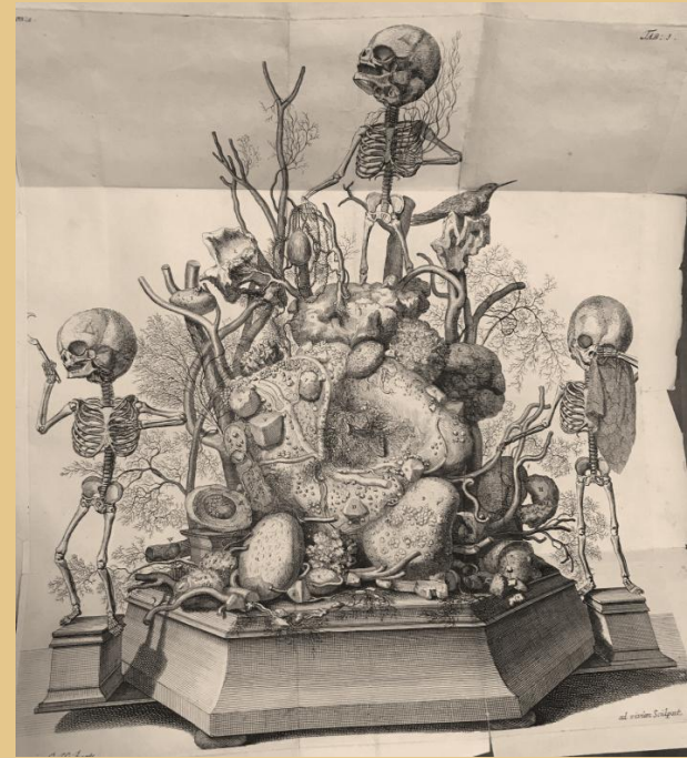
Ruysch F. Thesaurus anatomicus... Иллюстрация из книги фонда библиотеки ВолгГМУ