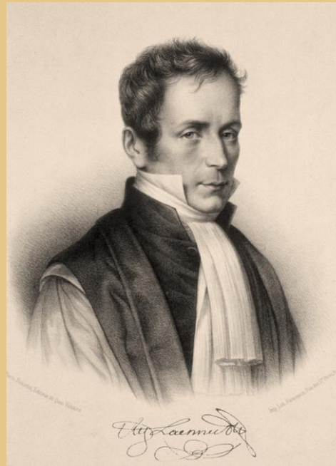
Изображение в общественном достоянии

Доктор Лаэннек (французский врач, один из основоположников современной клинической медицины и патологической анатомии) вел жесткую полемику с Ф. Бруссе